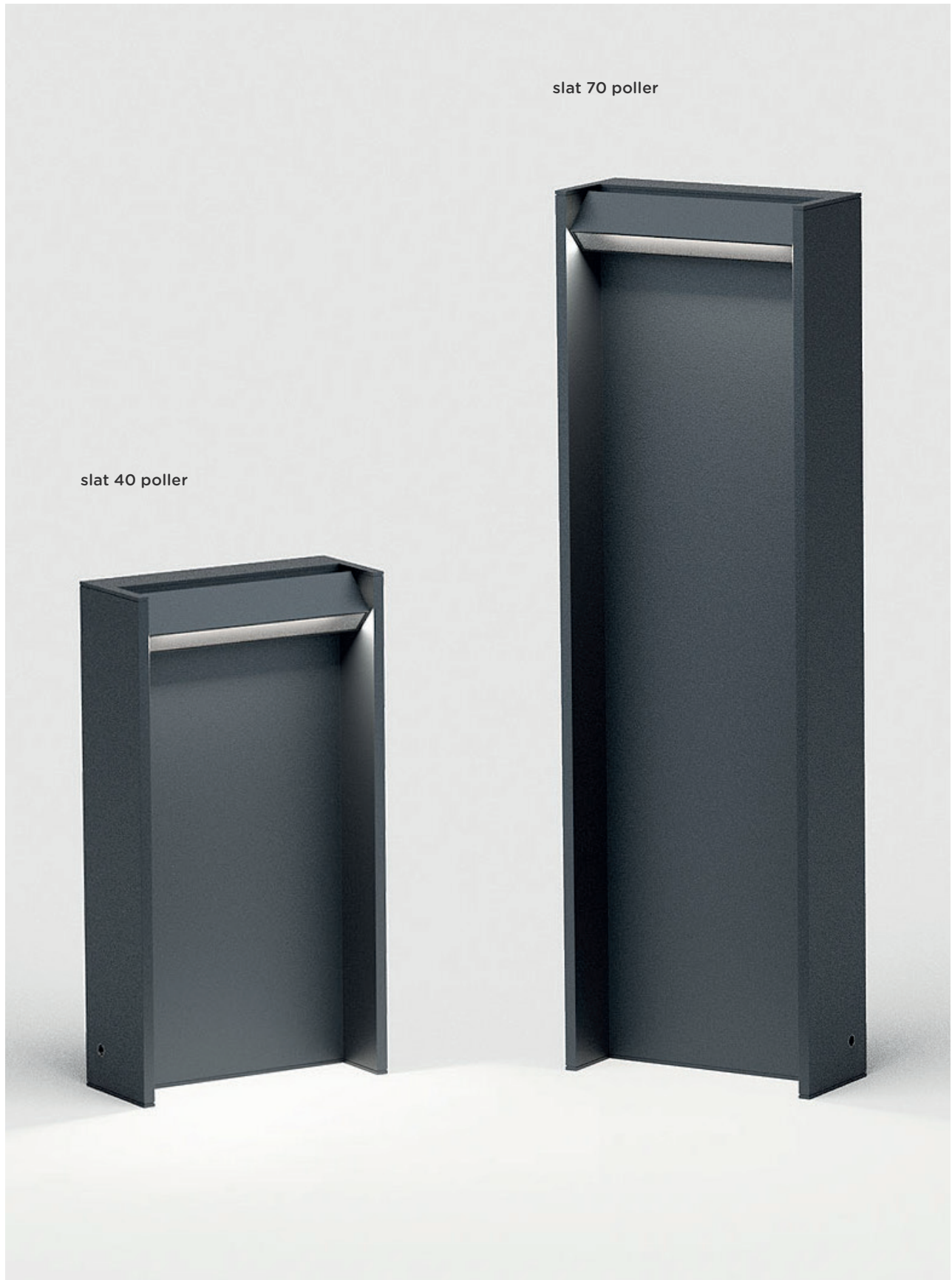
slat 40 poller