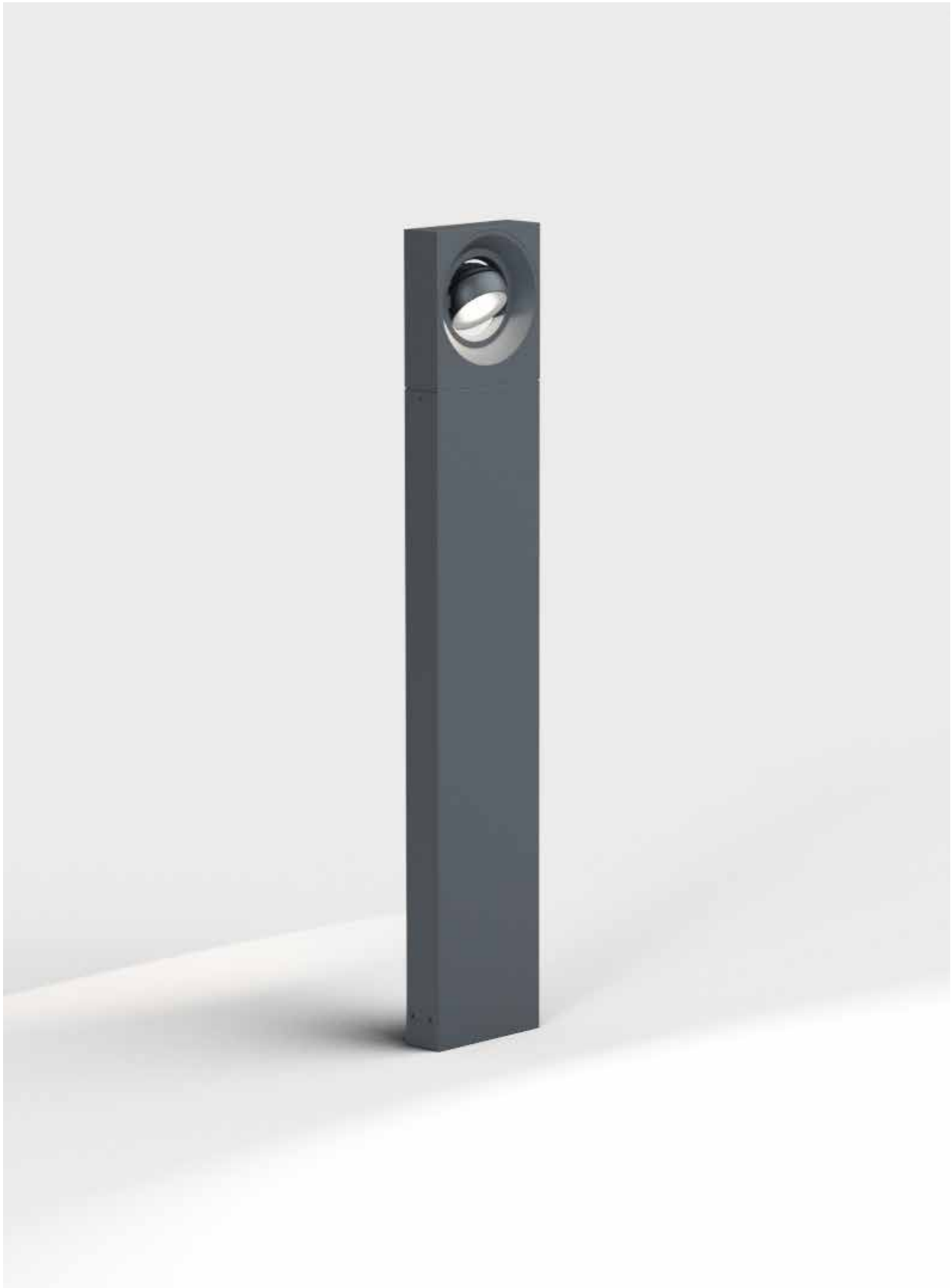
pip poller Design: Klaus Nolting